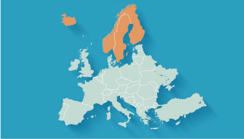
Lond, ið hava einkarsølu men ikki einkarinnskeyp

Ferðavinnufelagið er av teirri áskoðan, at talan er um eina óneyðuga forðing og at einkarinnskeypið hjá Rúsdrekkasølu Landsin eigur at avtakast. Hetta var eisini eitt valynski til lógtingsvalið í 2019. Felagið hevur í øðrum sambandi latið gjørt eitt filmsbrot fyri at lýsa trupulleikan.