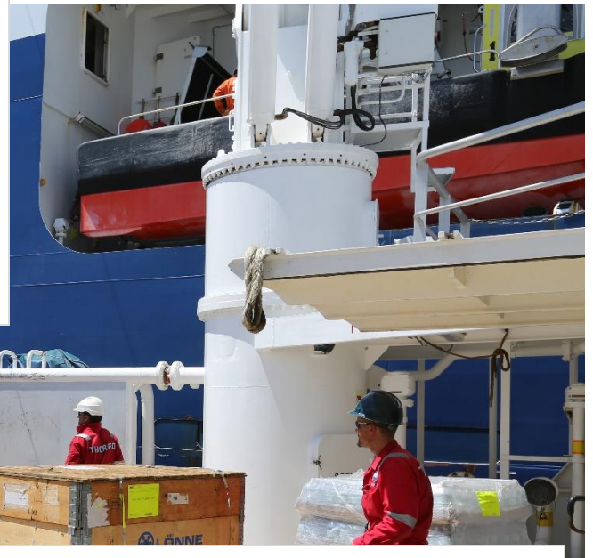
Starvsfólk í reiðariunum undir RFF januar 2018